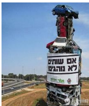
(用廢棄的汽車堆疊出酒瓶表達酒駕可能產生的結果)