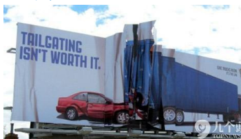
(用皺褶的看板表達跟車太近可能造成後果)